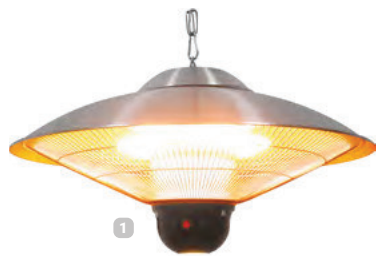
Fernbedienung passend zu Artikel CE0201001