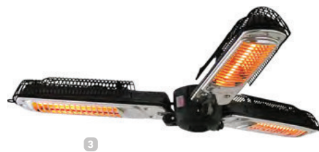
Sonnenschirm mit integriertem Heizstrahler