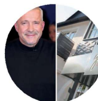
Alexander Herrmann 2-Sterne und TV-Koch

„Wir reinigen das ganze Posthotel nach dem Green Cleaning Concept® - unseren Gästen, Mitarbeitern und auch unserer Umwelt zuliebe! Und erreichen dadurch eine nachhaltige und bessere Hygiene, sowie hohe Einsparungen an Wasser, Zeit und Kosten!“